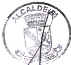
ULISES AEDO VALDES ALCALDE (S) I. MUNICIPALIDAD DE CHILLÁN VIEJO