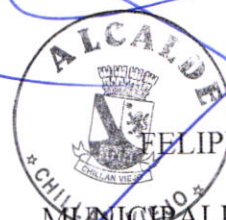
FELIPE AYLWIN LAGOS ALCALDE MUNICIPALIDAD DE CHILLAN VIEJO