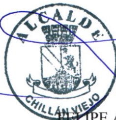
PELIPE AYLWIN LAGOS ALCALDE MUNICIPALIDAD DE CHILLAN VIEJO