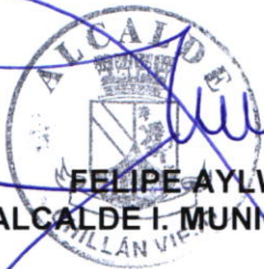
FELIPE AYLWIN LAGOS ALCALDE I. MUNICIPALIDAD DE CHILLAN VIEJO