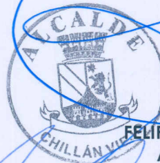
FELIPE AYLWIN LAGOS ALCALDE