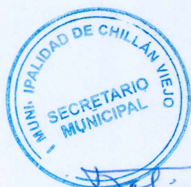
[Signature] FRANCISCO FUENZALIDA VALDES SECRETARIO MUNICIPAL

OCTAVO: El presente contrato se firma en cinco ejemplares, uno de los cuales recibe la Profesional a su entera satisfacción.