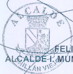
FELIPE AYLWIN LAGOS ALCALDE I. MUNICIPALIDAD DE CHILLAN VIEJO