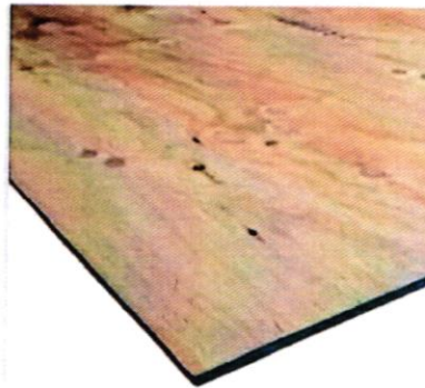
Foto referencial de plancha.

De acuerdo a lo informado por el contratista la plancha de terciado de 12 mm se encuentra discontinuado y ademas no existe el enchapado en Roble.