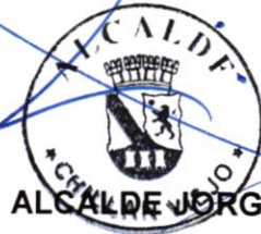
ALCALDE JORGE DEL POZO PASTENE

Los puntos no mencionados en esta modificación, se mantienen como el contrato original.