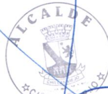
ALCALDE JORGE DEL POZO PASTENÉ RUT N° [REDACTED]