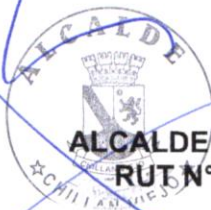
ALCALDE JORGE DEL POZO PASTENE RUT N° [REDACTED]