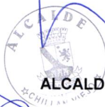
ALCALDE JORGE DEL POZO PASTENE