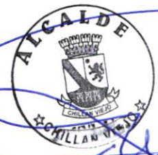
FELIPE AYLWIN LAGOS ALCALDE