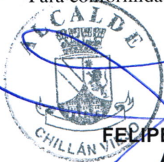
FELIPE AYLWIN LAGOS ALCALDE I. MUNICIPALIDAD DE CHILLAN VIEJO