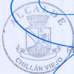
FELIPE AYLWIN LAGOS ALCALDE