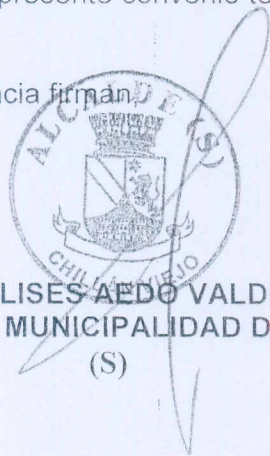
ULISES AEDO VALDES ALCALDE I. MUNICIPALIDAD DE CHILLAN VIEJO