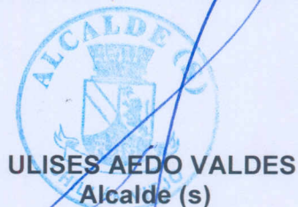
ULISES AEDO VALDES Alcalde (s)