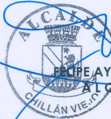
ELIPE AYIWIN LAGOS ALCALDE