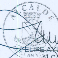
FELIPE AYLWIN LAGOS ALCALDE I. MUNICIPALIDAD DE CHILLAN VIEJO