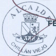
FELIPE AYLWIN LAGOS ALCALDE EMPLEADOR