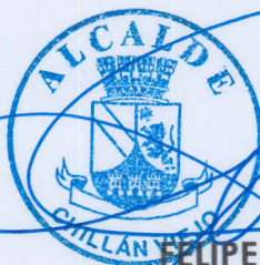
FELIPE AYLWIN LAGOS ALCALDE