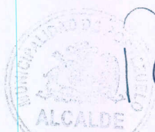
RENE SCHUFFENEGER SALAS Alcalde de Portezuelo

OCTAVO: El presente Convenio será sancionado mediante la dictación de los correspondientes decretos y resoluciones de formalización por las partes . En señal de conformidad, se suscribe este Convenio en seis ejemplares de igual tenor y data, quedando tres en poder cada municipalidad.