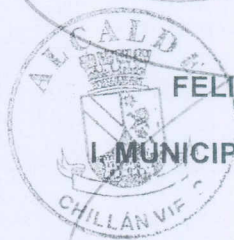
FELIPE AYLWIN LAGOS ALCALDE MUNICIPALIDAD DE CHILLAN VIEJO