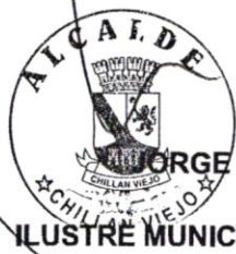
JORGE DEL POZO PASTENE ALCALDE ILUSTRE MUNICIPALIDAD DE CHILLAN VIEJO