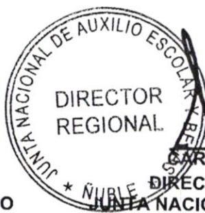
CARLOS GAJARDO LEIGH DIRECTOR REGIONAL ÑUBLE JUNTA NACIONAL DE AUXILIO ESCOLAR Y BECAS